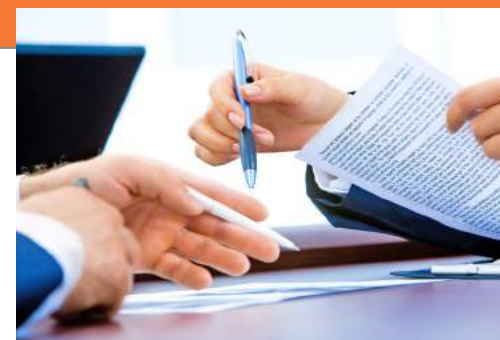
| SECOVI-SP. De acordo com órgão, recomendação é negociar