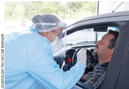
LOURIVALDO FIO/SECOM BARUERI

Barueri amplia testagem de Covid-19 na cidade PÁG. 8