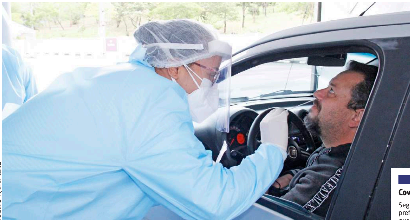
| ASSINTOMÁTICOS. Barueri realiza testagem em massa da população no estacionamento do Ginásio José Corrêa

De acordo com o documento publicado, entre os objetivos, está fazer constar no prontuário médico do paciente a realização do teste rápido e, em caso de morte, que seja feito o apontamento na sua declaração e, “garantir a realização de velório digno, ainda que em tempo reduzido, das pessoas que faleceram por outras doenças, de modo