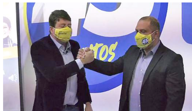
| REDES. Vereador e prefeito falaram sobre as propostas

Um dos destaques é a construção do novo Hospital e Maternidade Santa Ana, assunto que já se arrasta