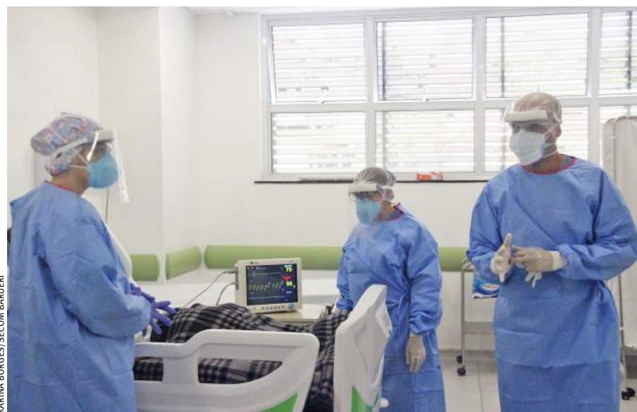
MARINA BORGES/SECOM BARUERI

Já a Cinemark (cinemark.com.br) fechou parceria com o Hospital Albert Einstein para adotar protocolos. Entre as medidas, haverá espaçamento das poltronas, além de fila de espera virtual para compras na bomboniere. Saiba mais sobre nos sites das redes.