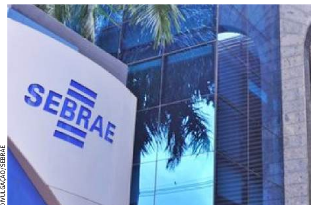
| PROGRAMAÇÃO. Evento acontecerá do dia 22 a 26 de novembro

A Feira do Empreendedor do Sebrae-SP, considerada o maior evento de empreendedorismo da América Latina, está com inscrições abertas ( www.sebrae.com.br ) para o evento que acontece entre os dias 22 e 26 de novembro, de forma online.