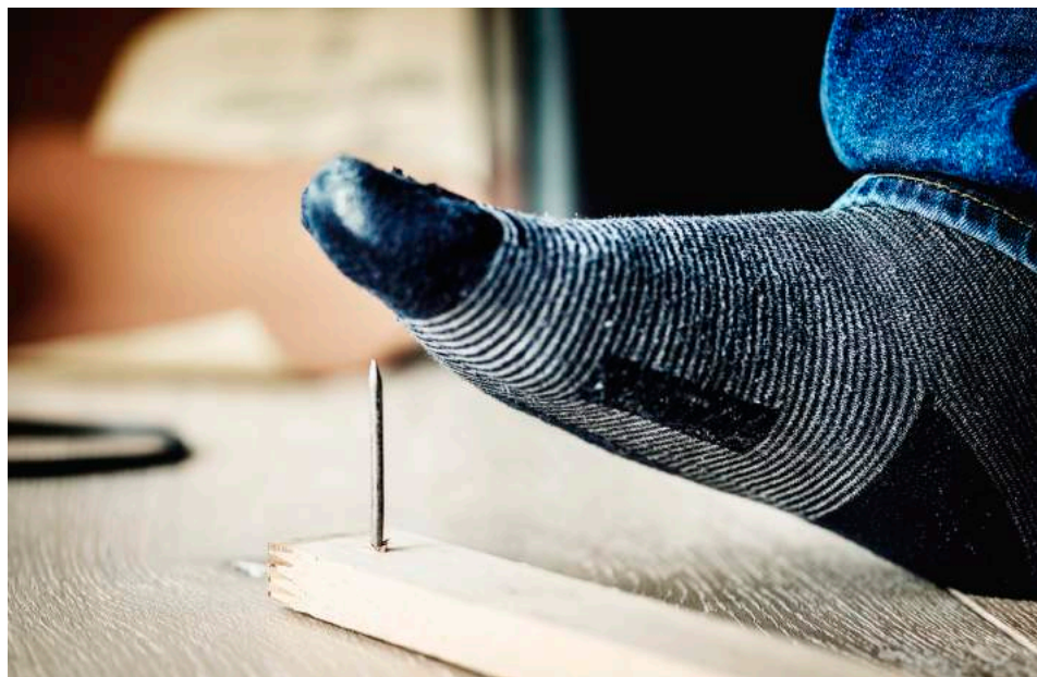
| ACIDENTES. Entre os mais comuns estão as ocorrências com instrumentos perfuro-cortantes, como vidro, faca e prego

Uma enquete feita nas redes sociais da Folha de Alphaville recentemente revelou que 12% dos que res-