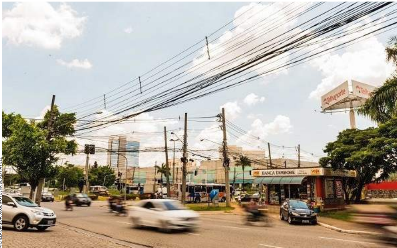
LOCALIZAÇÃO. Av. Piracema com a Al. Araguaia está na lista dos locais que sofrem com inundações na região do Tamboré

"Na segunda (19), Barueri registrou em poucas horas na região do Tamboré o volume de 75 mm de precipitação, sendo que acima