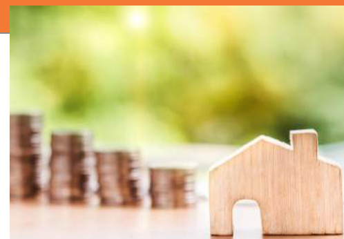
| LEVANTAMENTO. De janeiro a julho foram 8,7 mil operações