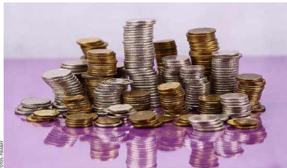
NACIONAL. Apenas 36% optaram pela ascensão da economia

Segundo enquete realizada nesta semana pela Folha de Alphaville , nas redes sociais, 56% dos participantes concordaram com o estudo citado e optaram pelo progresso social ao invés do crescimento econômico. Já 44% preferiram a retomada da econo-