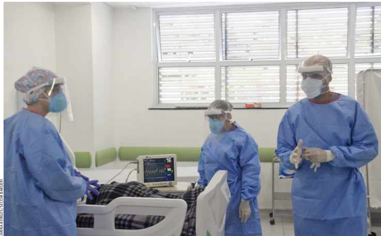
| BARUERI. Nesta quinta-feira (24), cidade chegou a 6.450 infectados pela Covid-19 e 349 óbitos

Para permitir que a população tenha acesso a um conjunto de informações integradas dos municípios em relação a pandemia da Covid-19, o Instituto Brasileiro de Geografia e Estatística (IBGE) lançou na segunda-feira (21) o Painel Covid-19 Síntese por Município.