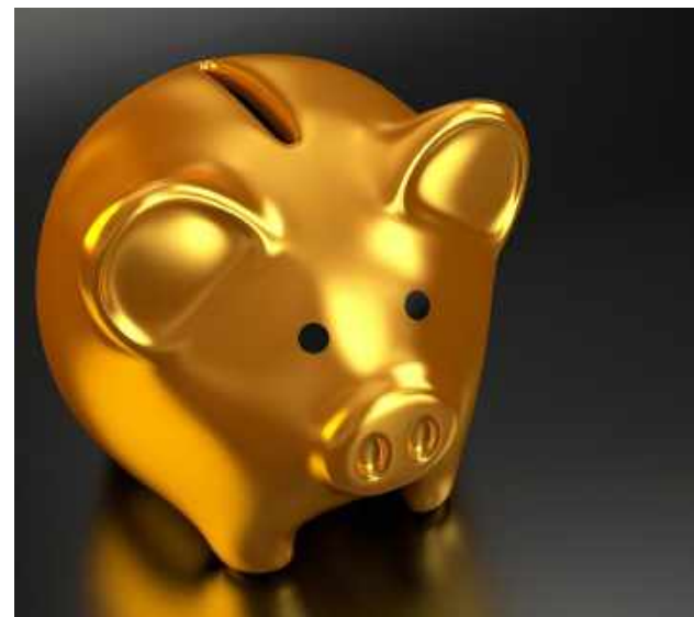
| COFRES. Prefeituras tiveram queda de arrecadação

Um levantamento feito pelo Tribunal de Contas do Estado de São Paulo revela que 95% dos municípios da unidade da Federação estão em situação de comprometimento das gestões fiscal e orçamentária. Os dados são relativos ao terceiro bimestre de 2020, abrangendo os meses de maio e junho.