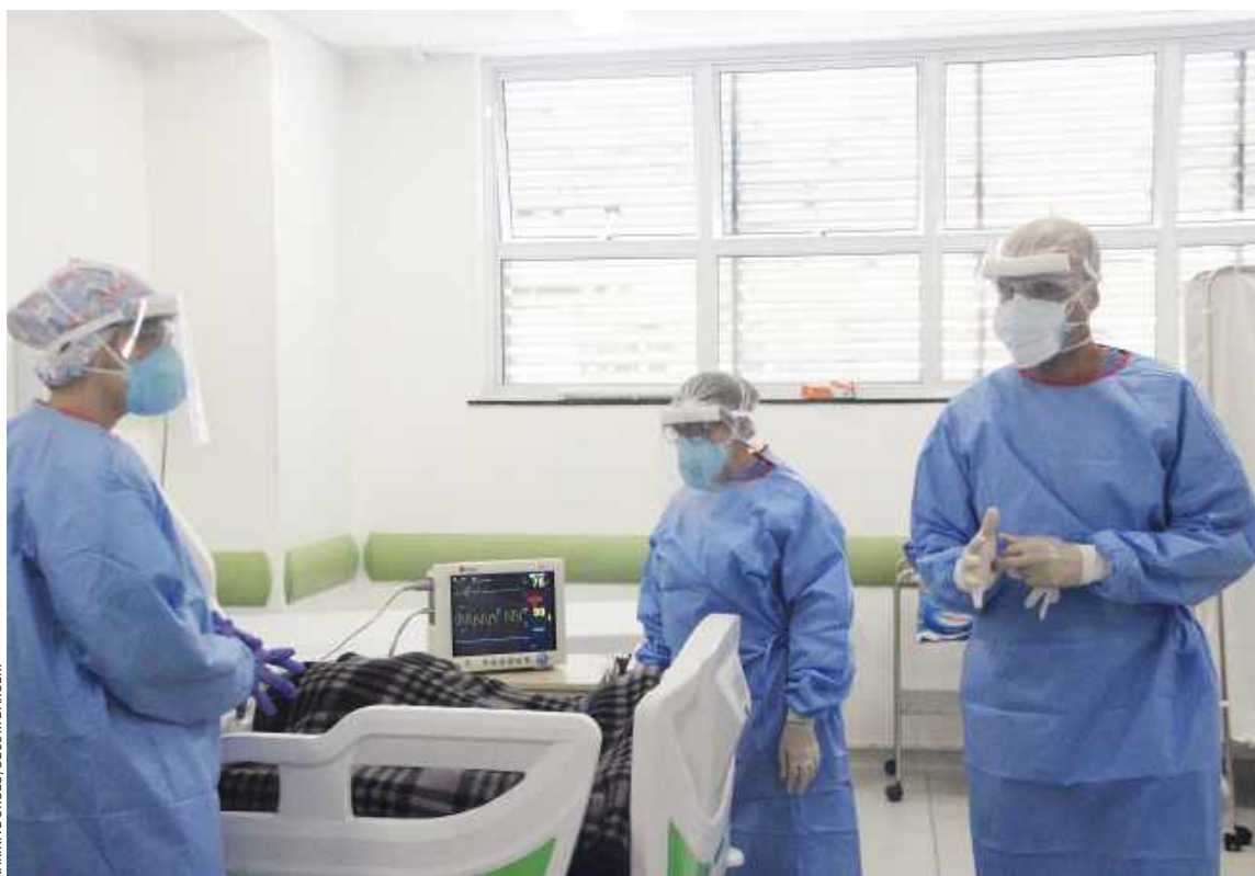
KARINA BORGES/SECOM BARUERI

Construção do Hospital Regional deve começar em outubro PÁG. 8