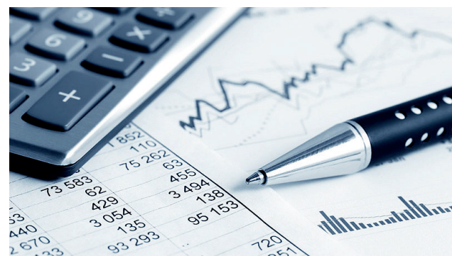
I ESTADUAL. O novo indicador representa 97% do PIB

O Seade lançou o indicador PIB+30, com o objetivo de monitorar as tendências da economia paulista no contexto da pandemia provocada pelo Covid-19, o Seade se mobilizou para desenvolver novos indicadores. O PIB+30 permite observar as estatísticas preliminares do Produto Interno Bruto - PIB do Estado de São Paulo. O indicador representa cerca de