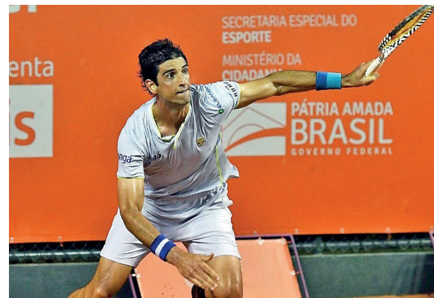
| DESTAQUE. Thomaz é o 2º mais bem colocado no ranking da ATP

Setembro. Esta é a previsão de retorno do tenista e morador de Alphaville Thomaz Bellucci às quadras. Ele é o segundo atleta mais bem colocado no ranking da ATP, referência para definir quem serão os cabeças de chave dos Grand Slams e demais torneios do circuito, após Gustavo Kuerten.