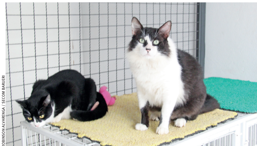
Em Barueri, adoções de animais será feita pelo WhatsApp

Outros radares também serão ativados, como na R. Constantinopla, Av. Cândido Portinari, Estr. Tenente Marques e na Estr. Turística do Suru.