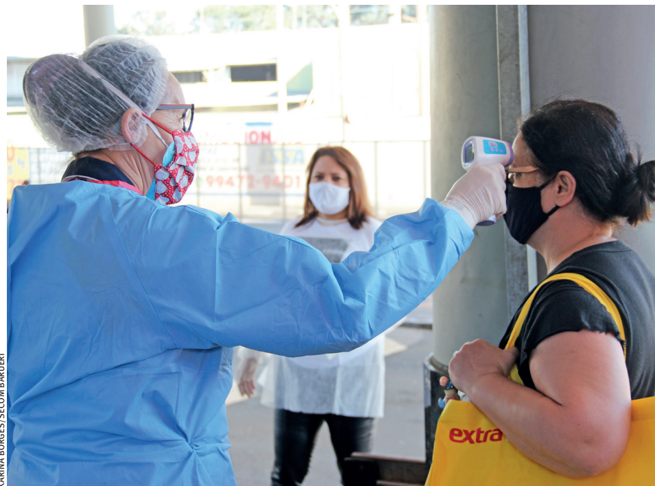
| CIDADES. Em Barueri e em Santana de Parnaíba, a faixa etária mais atingida pelo novo coronavírus (Covid-19) são de pessoas a partir de 30 anos a 49 anos

“Considerando que a cidade possui uma população estimada de 274.182 mil habitantes (IBGE 2019) e que, de acordo com o boletim do dia 10, tínhamos 8.490 casos confirmados (4.320 casos confirmados; 3.882 casos confirmados e curados; e 288 óbitos con-